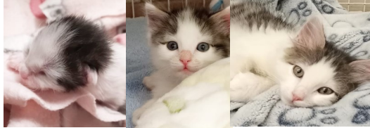
Oreo, cuidado por Animal Samaritans SPCA desde los tres días de edad a través del Programa de Cuidado en Casa. Fue adoptado a los cuatro meses de edad.

Los refugios sin sacrificar rescatan a muchos animales diferentes, ya sean sanos, enfermos, viejos o recién nacidos. Por esta razón, a menudo buscan nuevos voluntarios para ayudar en el refugio y para criar mascotas que necesitan atención las 24 horas del día, los 7 días de la semana.