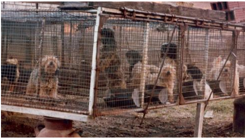
Perros de Molinos/fábricas viven en jaulas de alambre donde comen, van al baño y duermen. Estas jaulas se limpian con una manguera con los perros dentro. Este método de limpieza es peligroso e ineficaz.

Los perros en las fábricas de cachorros a menudo viven en jaulas estrechas y sucias. Estos perros no reciben atención veterinaria cuando es necesario. Lamentablemente, muchos de ellos contraen infecciones o se lesionan y mueren dentro de las jaulas. Algunos perros fallecidos pasan desapercibidos durante días. Los perros rescatados de las fábricas de cachorros suelen tener una discapacidad física y están traumatizados debido a la negligencia y las malas condiciones sanitarias en la fábrica de cachorros.